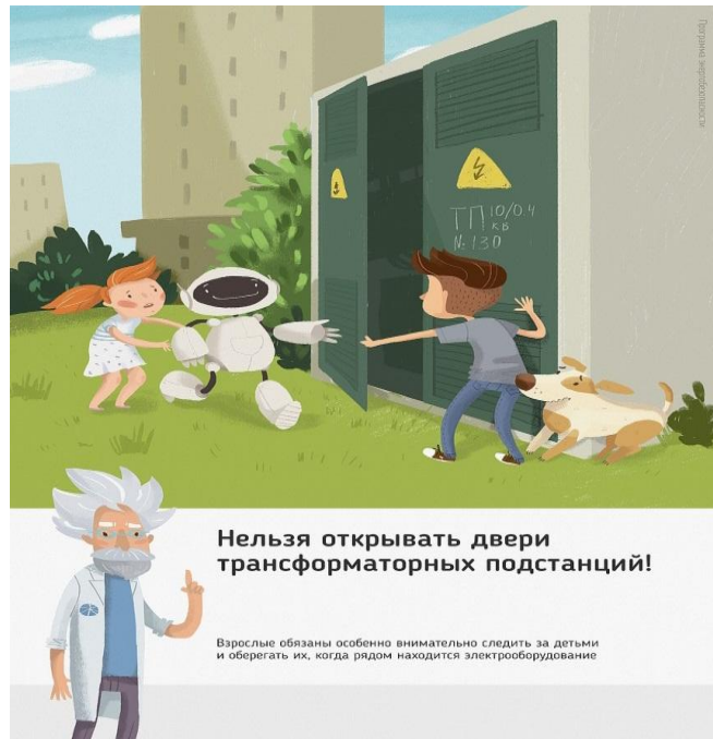
Рис.1 Нельзя открывать двери трансформаторных подстанций

Ежегодно энергетики проводят для школьников познавательные уроки, конкурсы рисунков и историй на тему электричества и правильного с ним обращения. Но работы одних энергетиков в данном направлении недостаточно, для полного понимания проблем электробезопасности нужен пример общества, в котором растет ребенок, и, конечно же, главным образом родителей. Эта работа приносит свои результаты: электротравмы на энергетических объектах единичные, и каждый случай становится поводом для служебной проверки. Но только технических мер мало для того, чтобы полностью обезопасить детей. Им нужен пример родителей.