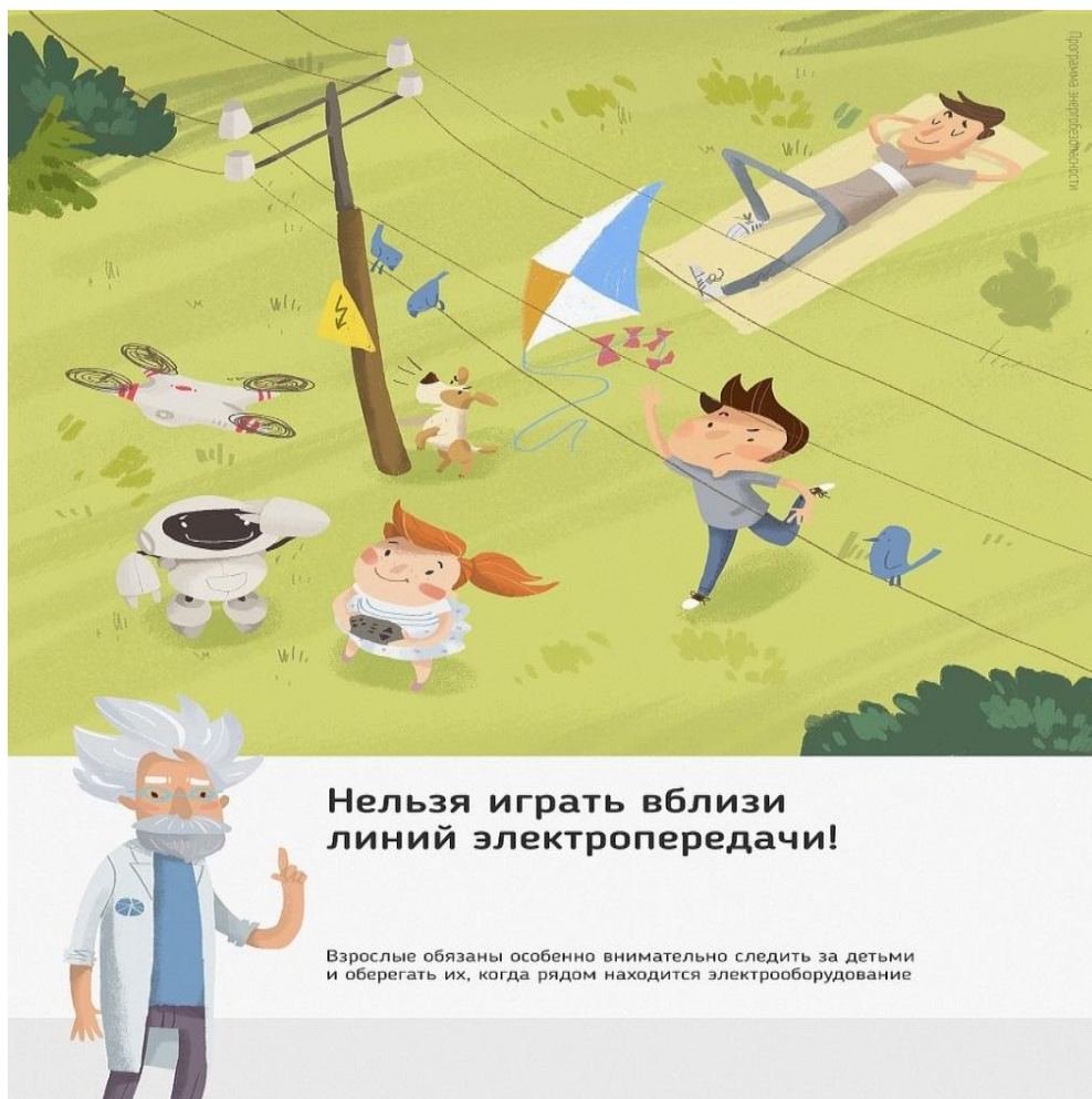
Рис.3 Нельзя играть вблизи линий электропередачи