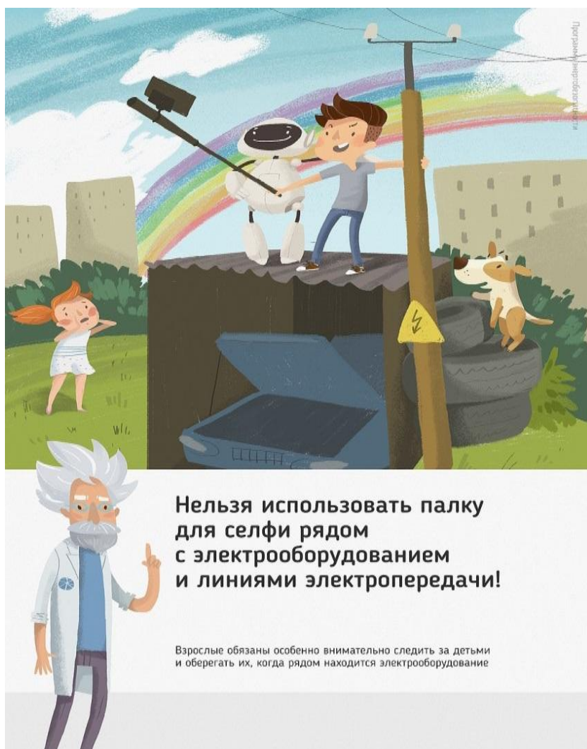
Рис 2. Нельзя использовать палку для селфи рядом с электрооборудованием и линиями электропередачи

Ну и, наконец, нужно повторить с ребенком алгоритм действий в экстремальной ситуации. Проверьте, умеет ли он набирать на сотовом телефоне телефон экстренных служб. Изучите с ним вещества и предметы, которые хорошо проводят электрический ток и потому особенно опасны, и, наоборот, вещества и предметы, плохо проводящие электрический ток и полезные в экстремальной ситуации.